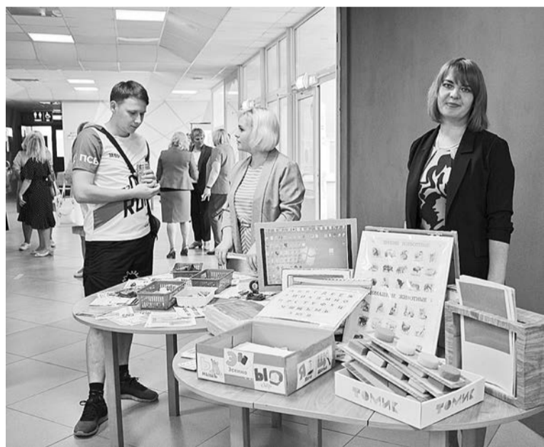
Наглядные пособия демонстрирует детсад № 1 (подразделение школы № 7), которому присвоен статус федеральной стажировочной площадки